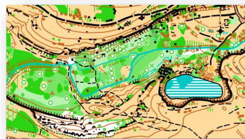
Схема на състезателния район